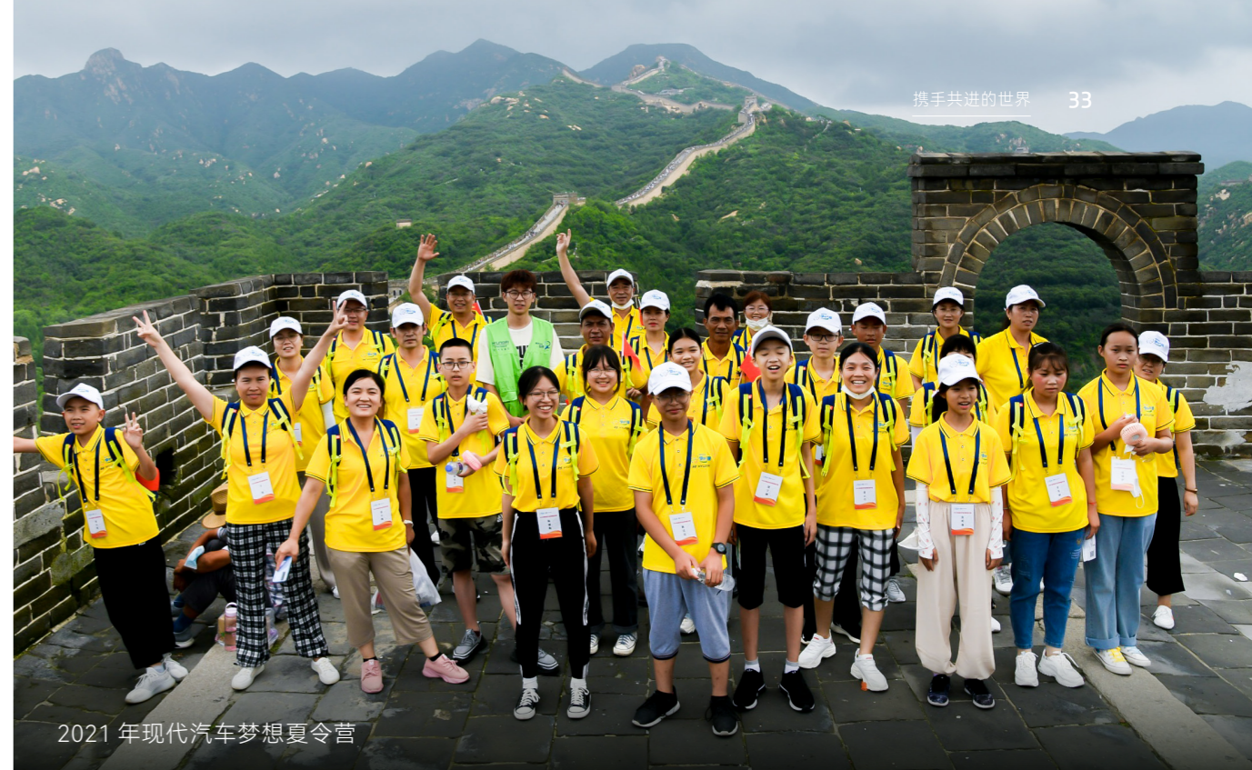
2021年现代汽车梦想夏令营