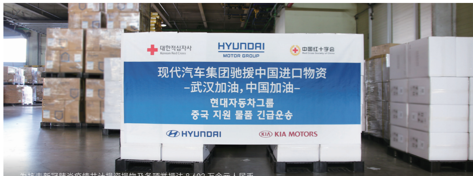
为抗击新冠肺炎疫情共计捐资捐物及各项举措达 8,602 万余元人民币。