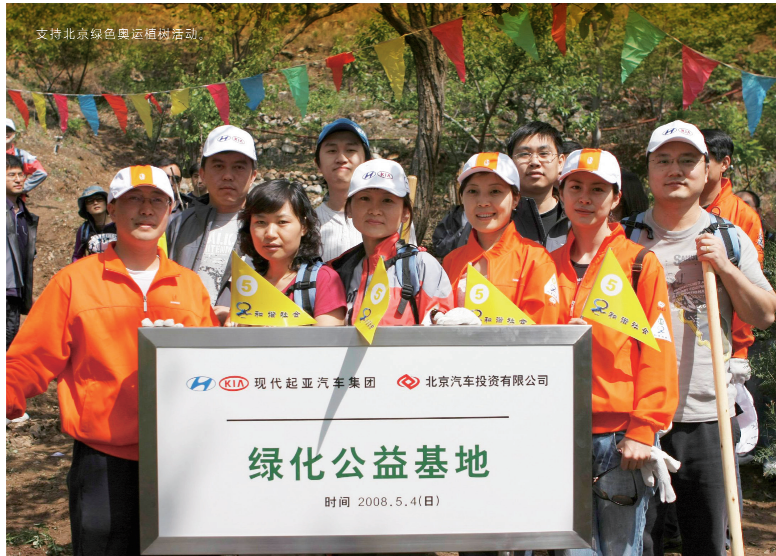
支持北京绿色奥运植树活动。