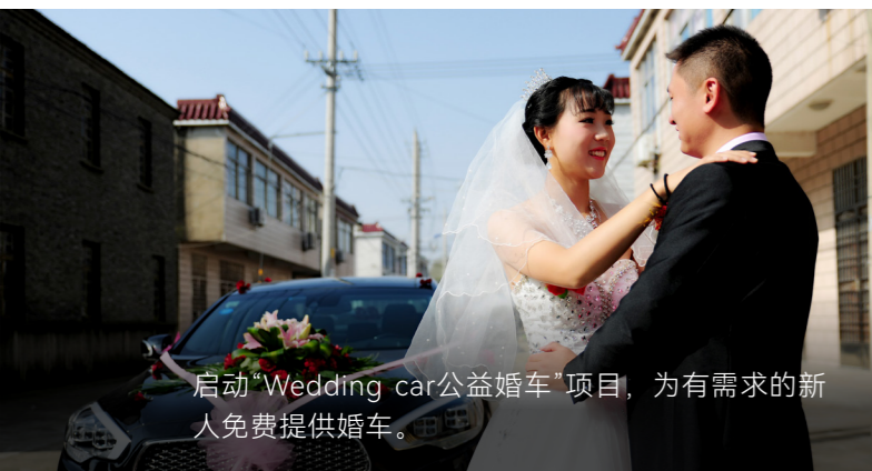
启动“Wedding car公益婚车”项目，为有需求的新人免费提供婚车。