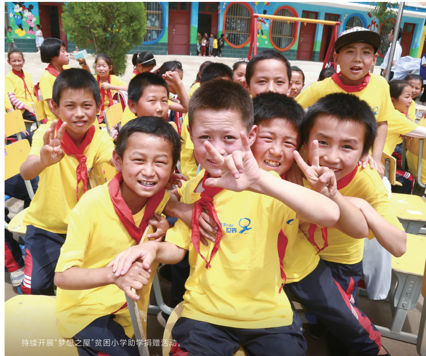
持续开展“梦想之屋”贫困小学助学捐赠活动。