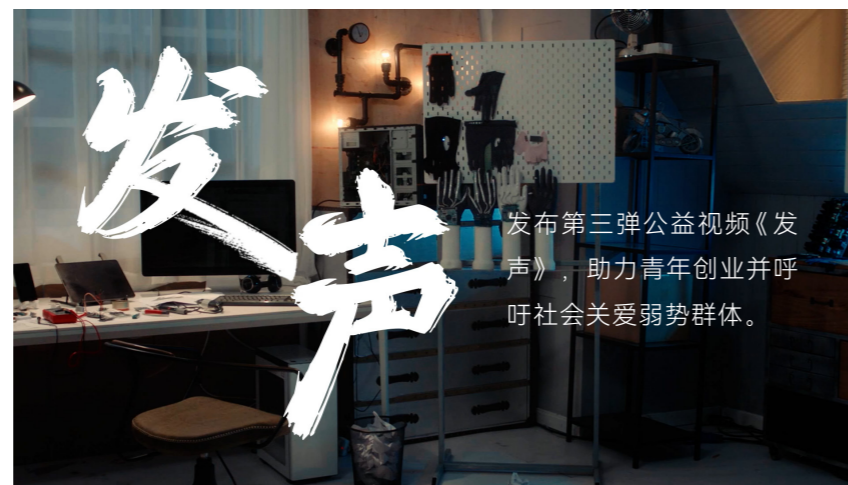
发布第三弹公益视频《发声》，助力青年创业并呼吁社会关爱弱势群体。