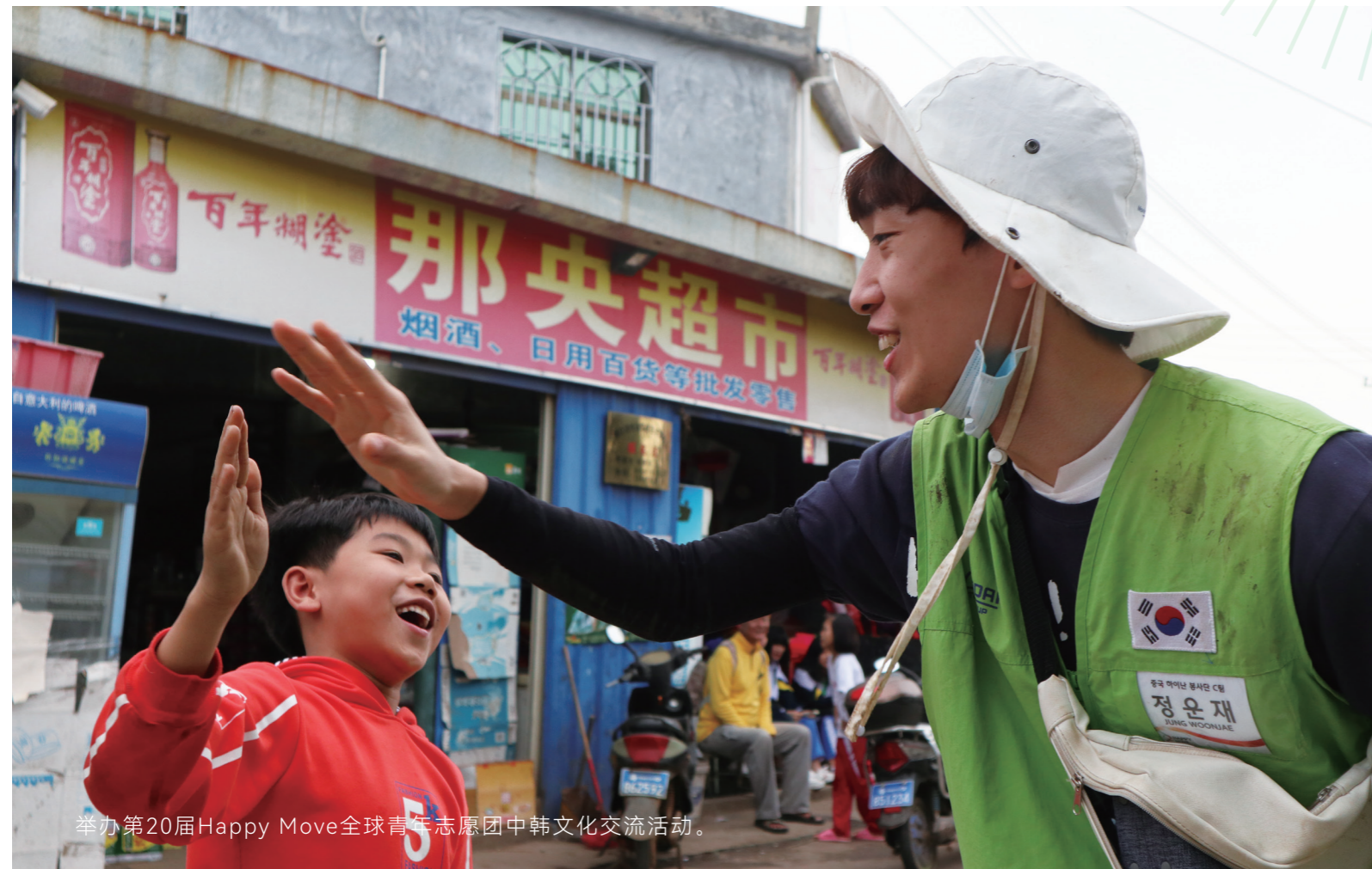
举办第20届Happy Move全球青年志愿团中韩文化交流活动。