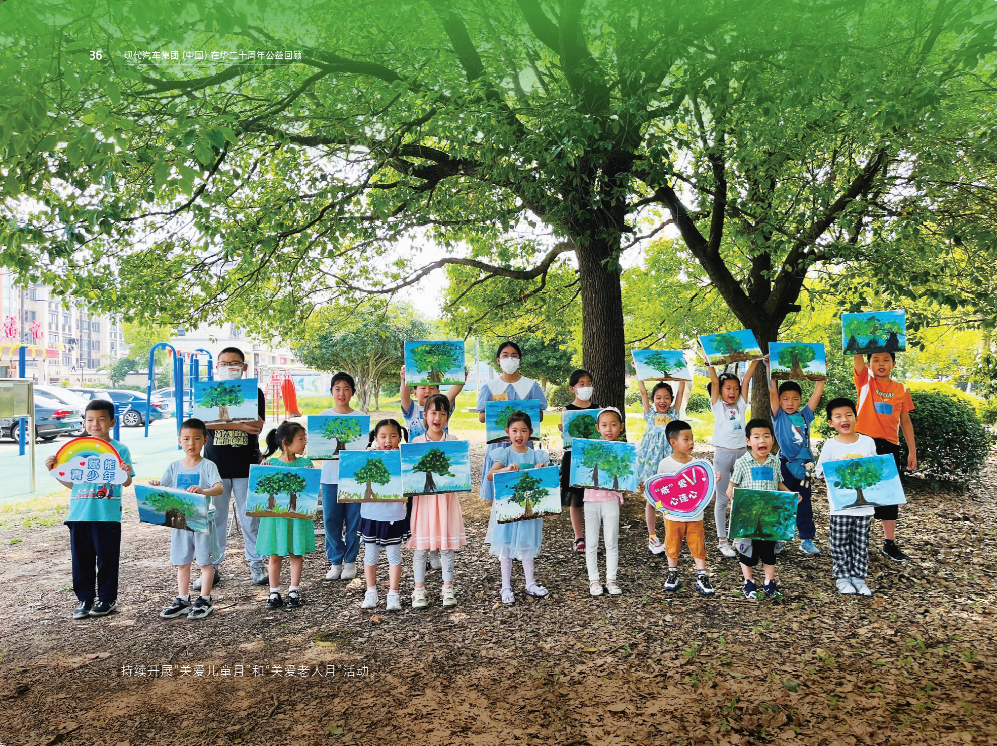
持续开展“关爱儿童月”和“关爱老人月”活动。

回首过往，凝聚温暖力量再出发。未来，现代汽车集团将站在二十周年的新起点上，在“携手共进的世界”公益口号指引下，与各利益相关方并肩前行，用温暖能量点燃公益火炬，用爱心关怀传递人间温情，共筑绿色、安全、友爱、美好、创新的幸福家园！