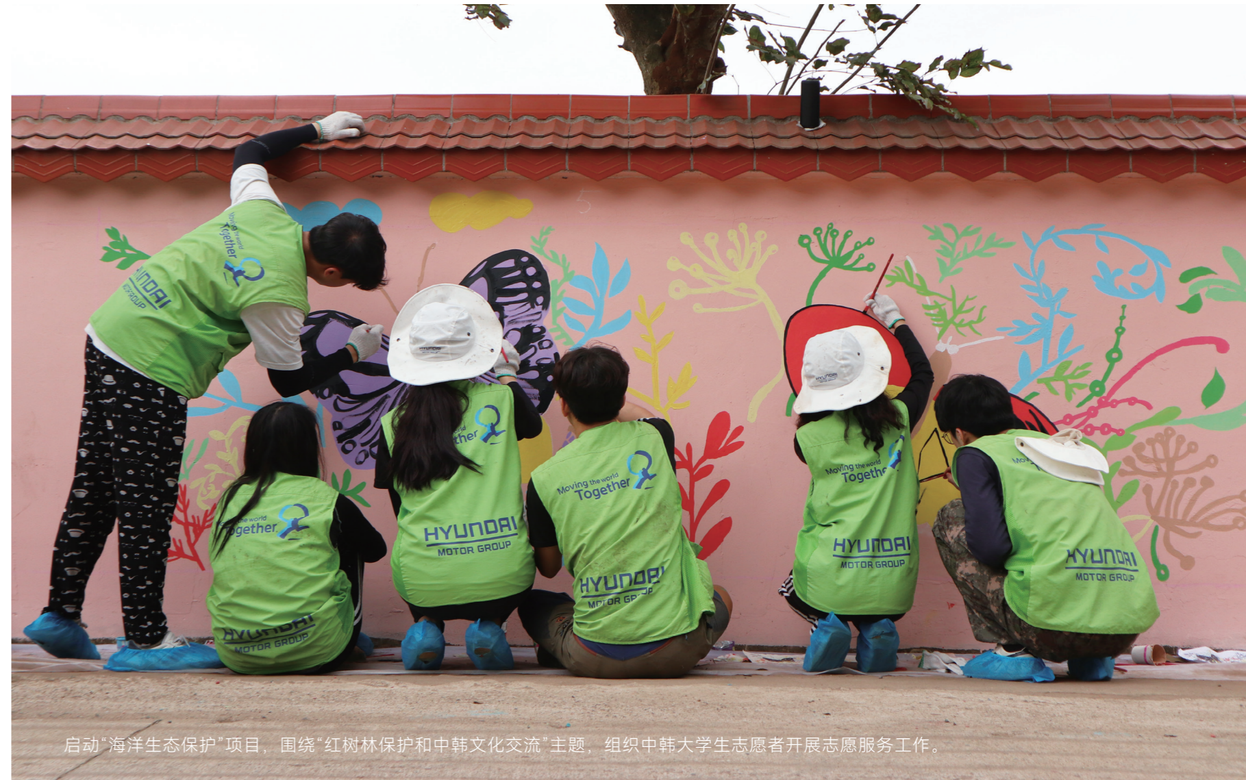
启动“海洋生态保护”项目，围绕“红树林保护和中韩文化交流”主题，组织中韩大学生志愿者开展志愿服务工作。