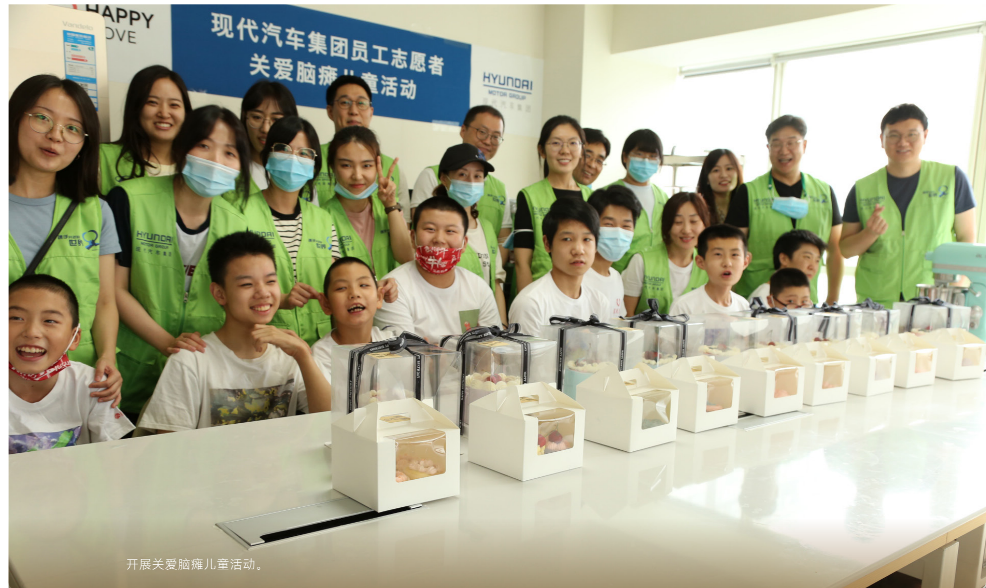
开展关爱脑瘫儿童活动。