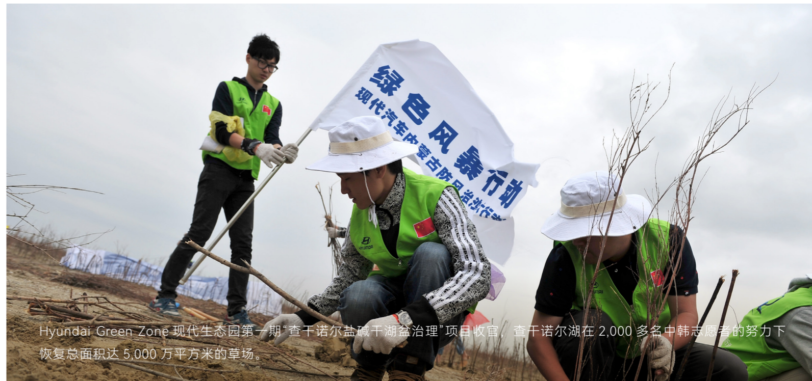
Hyundai Green Zone 现代生态园第一期“查干诺尔盐碱干湖盆治理”项目收官，查干诺尔湖在2,000多名中韩志愿者的努力下恢复总面积达5,000万平方米的草场。