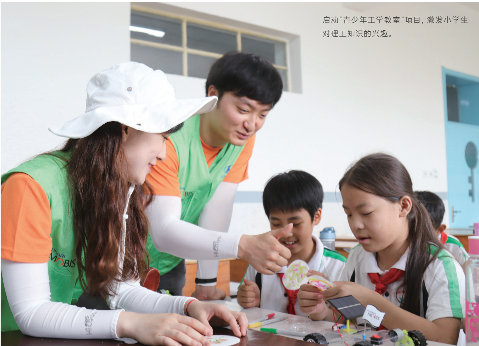
启动“青少年工学教室”项目，激发小学生对理工知识的兴趣。