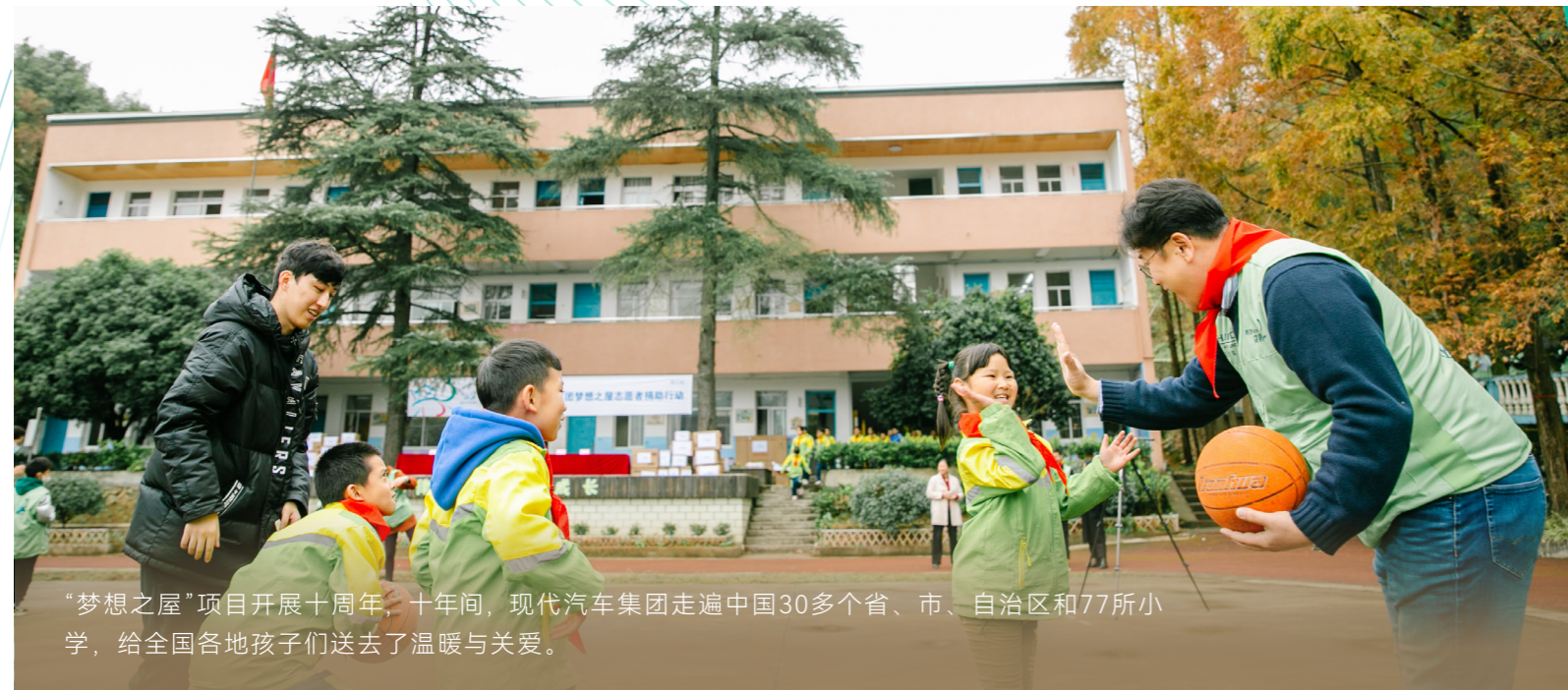
“梦想之屋”项目开展十周年，十年间，现代汽车集团走遍中国30多个省、市、自治区和77所小学，给全国各地孩子们送去了温暖与关爱。