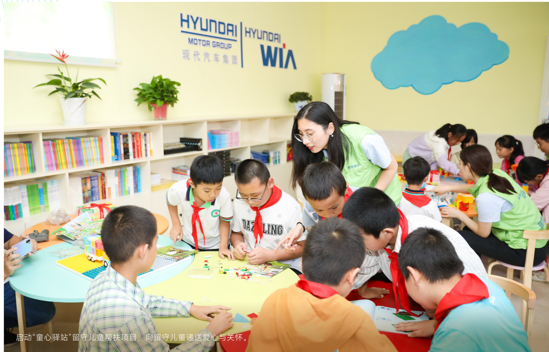
启动“童心驿站”留守儿童帮扶项目，向留守儿童递送爱心与关怀。

将每年的6月和10月分别定为集团“关爱儿童月”和“关爱老人月”，号召在华法人在当地社区积极开展关爱儿童和老人的活动。