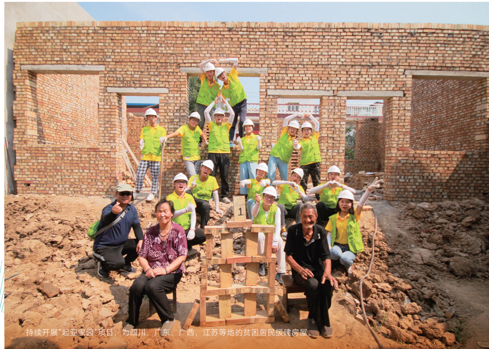
持续开展“起亚家园”项目，为四川、广东、广西、江苏等地的贫困居民援建房屋。