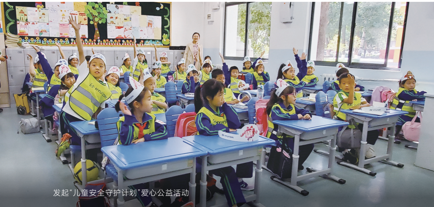
发起“儿童安全守护计划”爱心公益活动