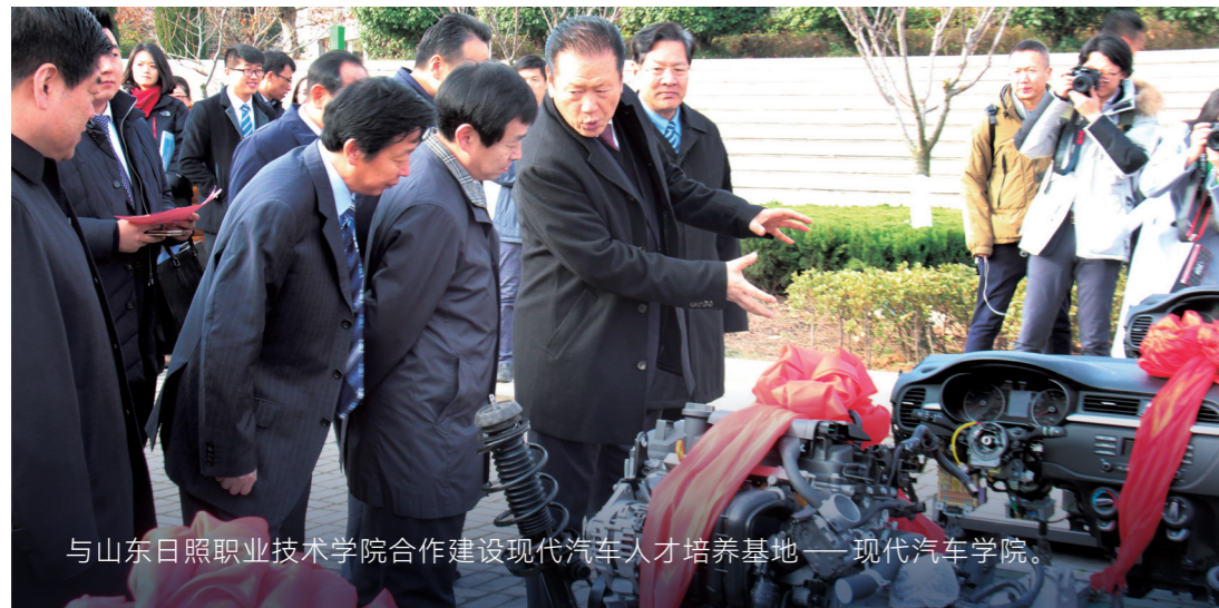
与山东日照职业技术学院合作建设现代汽车人才培养基地——现代汽车学院。