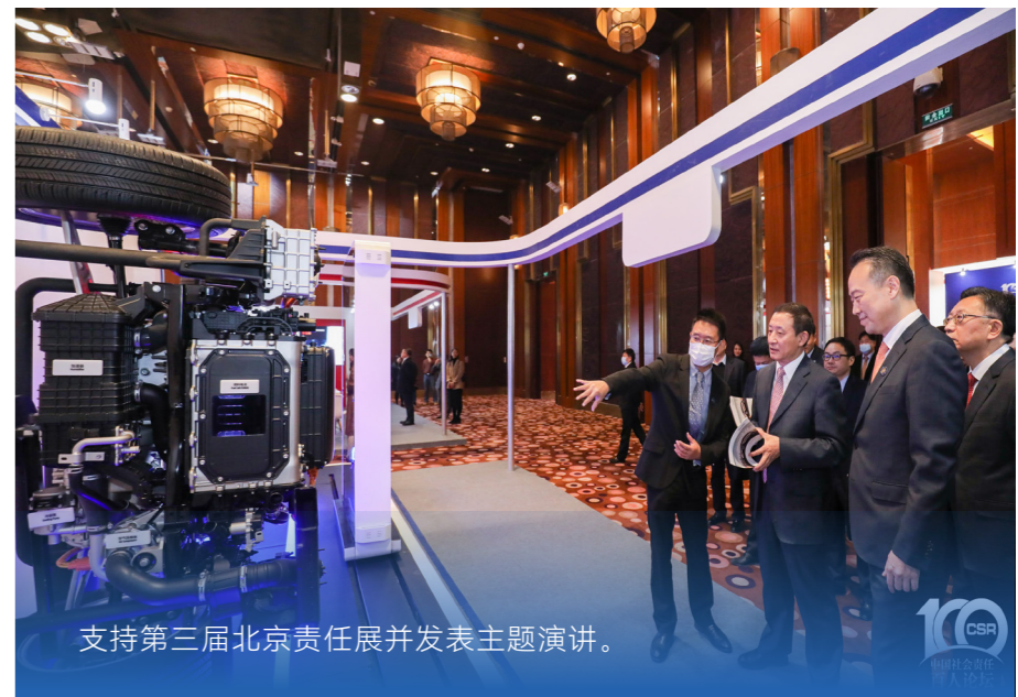
支持第三届北京责任展并发表主题演讲。

赋予Hyundai Green Zone现代生态园项目新的内涵，在内蒙古乌兰察布市兴和县开展乡村振兴示范项目，助力乡村向绿色低碳、可持续发展方向转型升级。