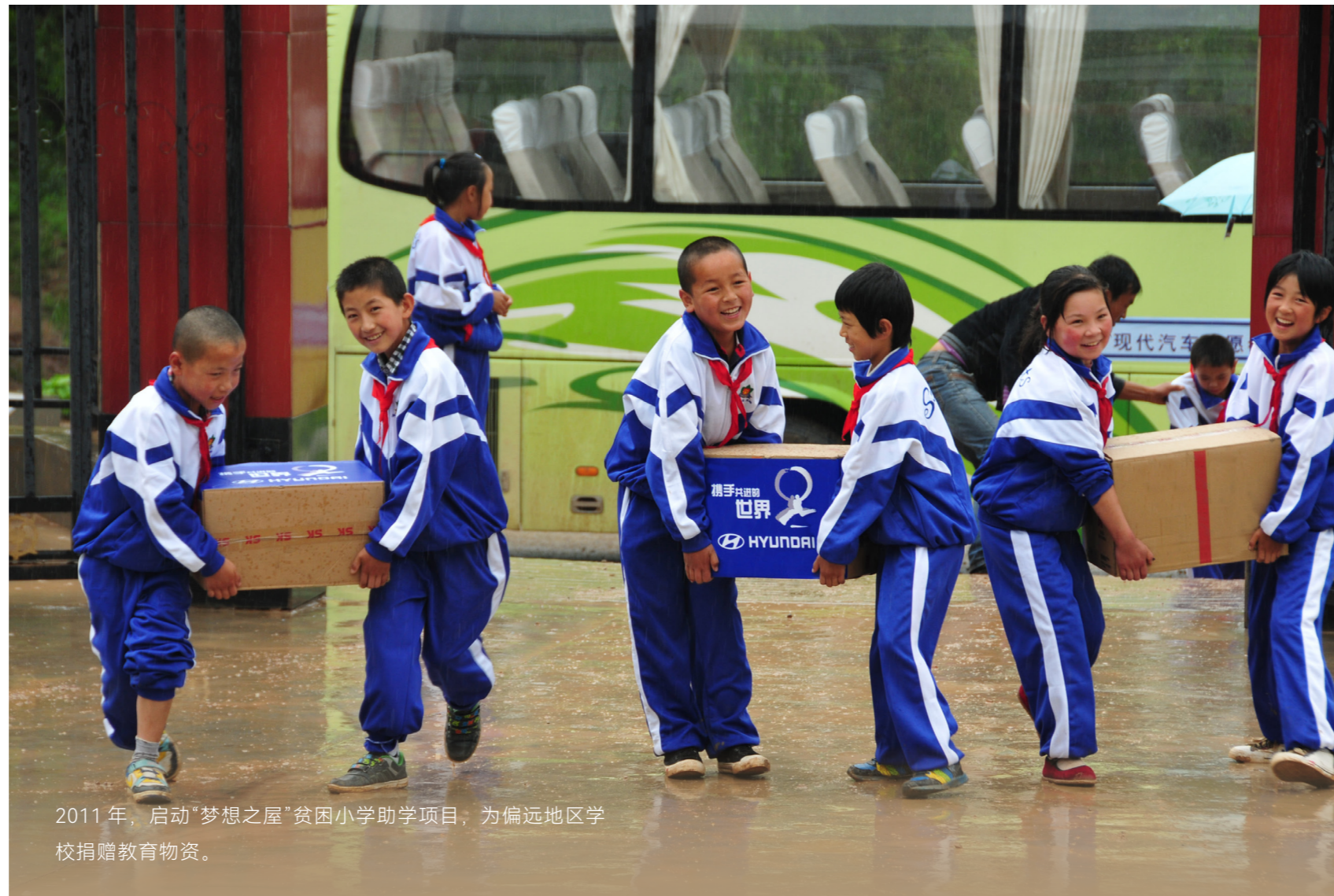
2011年，启动“梦想之屋”贫困小学助学项目，为偏远地区学校捐赠教育物资。