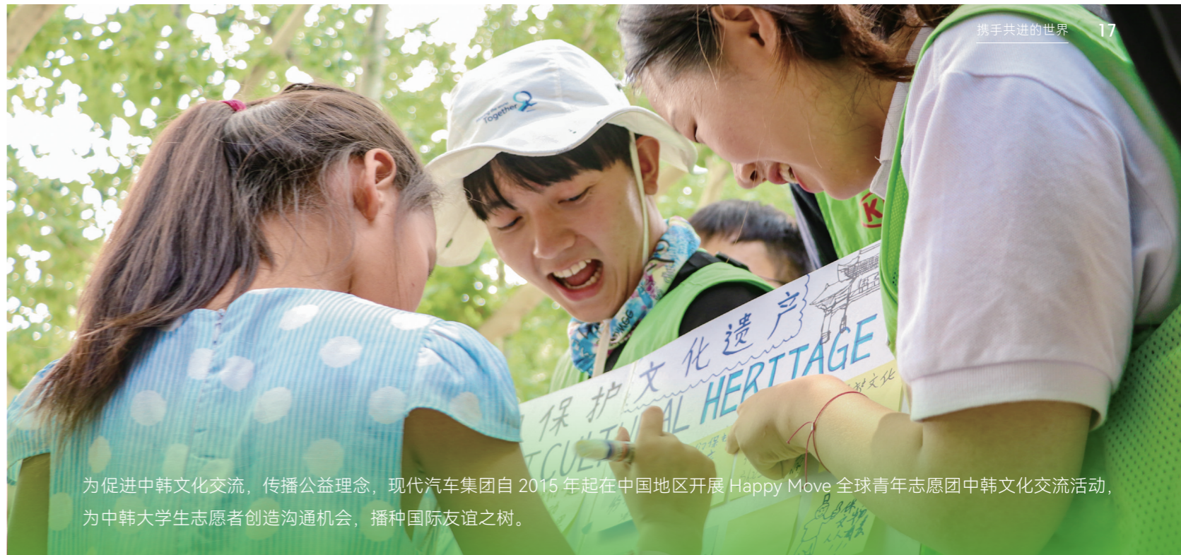
为促进中韩文化交流，传播公益理念，现代汽车集团自 2015 年起在中国地区开展 Happy Move 全球青年志愿团中韩文化交流活动，为中韩大学生志愿者创造沟通机会，播种国际友谊之树。