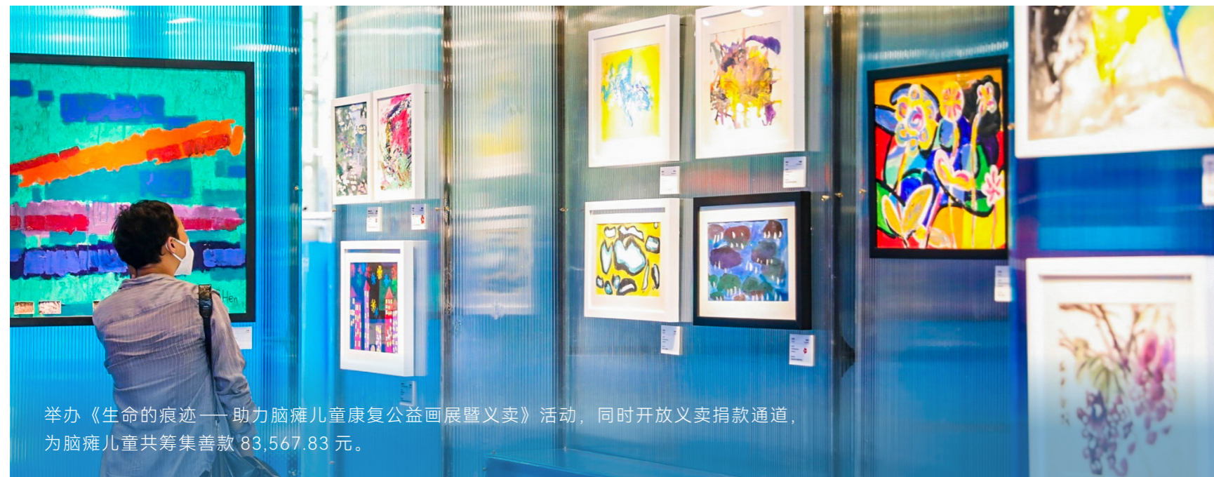
举办《生命的痕迹——助力脑瘫儿童康复公益画展暨义卖》活动，同时开放义卖捐款通道，为脑瘫儿童共筹集善款 83,567.83 元。