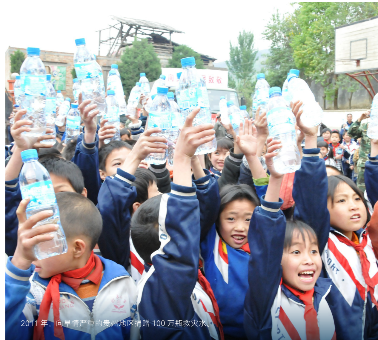
2011年，向旱情严重的贵州地区捐赠100万瓶救灾水。