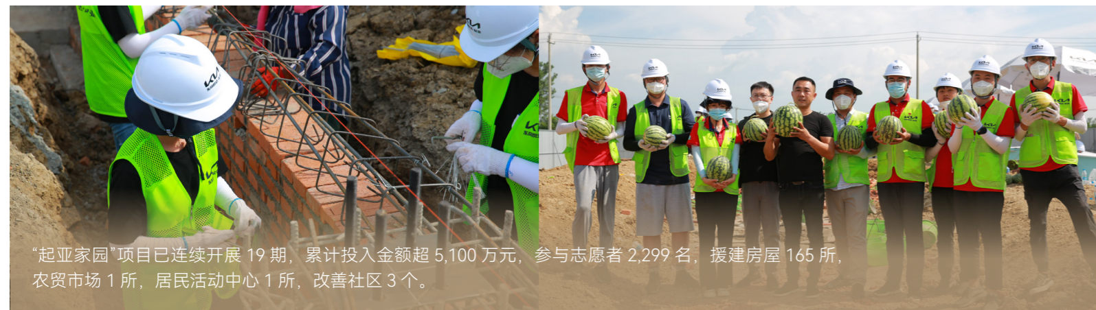
“起亚家园”项目已连续开展19期，累计投入金额超5,100万元，参与志愿者2,299名，援建房屋165所，农贸市场1所，居民活动中心1所，改善社区3个。