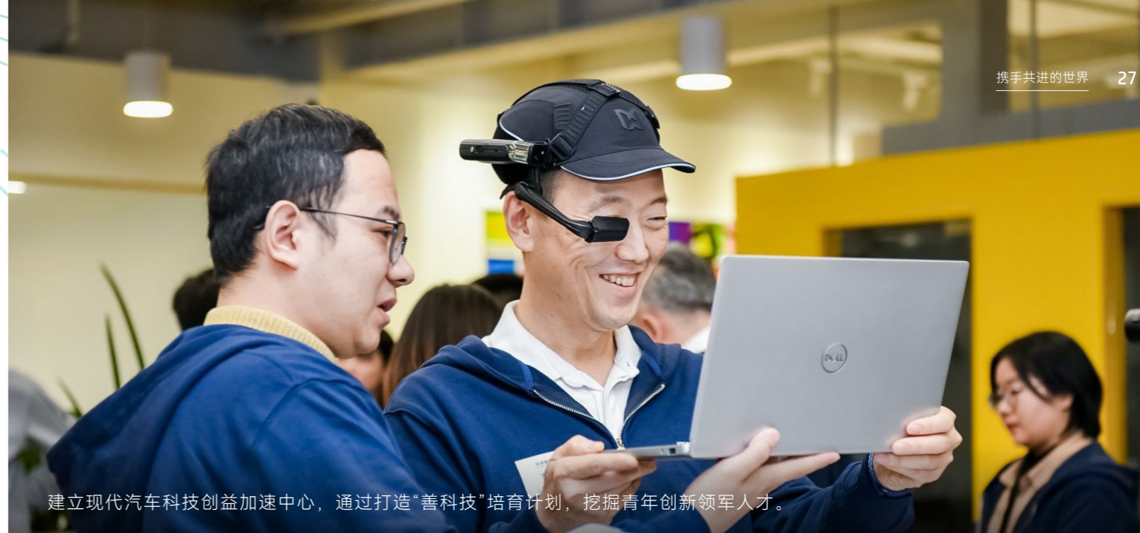
建立现代汽车科技创益加速中心，通过打造“善科技”培育计划，挖掘青年创新领军人才。